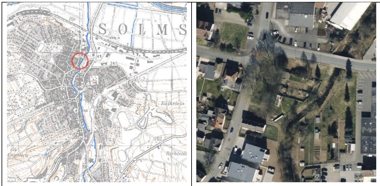
Abbildung 1: Lage des Plangebiets in der TK 25 und im Luftbild (Natureg u. Stadt Solms)

Aufgrund der Privilegierung des gewählten Bauleitplanverfahrens entfällt die Pflicht zur Bereitstellung des naturschutzrechtlichen Eingriffsausgleichs.