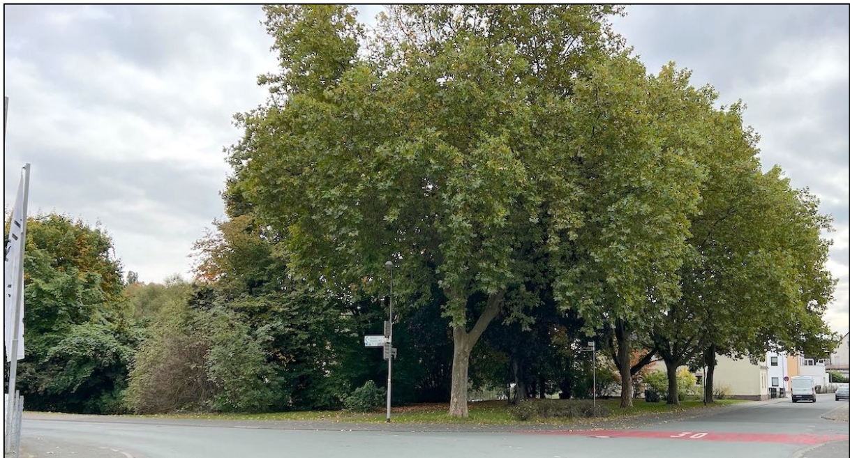
Abbildung 2: Der Park von der Kreuzung Bahnhofsallee/Brückenstraße (10/2022)

In der Uferböschung nahe der Brückenstraße etabliert sich der Riesen-Bärenklau ( Heracleum mantegazzianum ). Diese Art wird auf der Management-Liste der „Schwarzen Liste invasiver Pflanzenarten“ 3 geführt. Der Saft der Pflanze kann schwere Hautverletzungen nach sich ziehen. Im Ordnungsbereich, zumal wenn Kinderspiel zu erwarten ist, sollte die Pflanze radikal bekämpft werden.