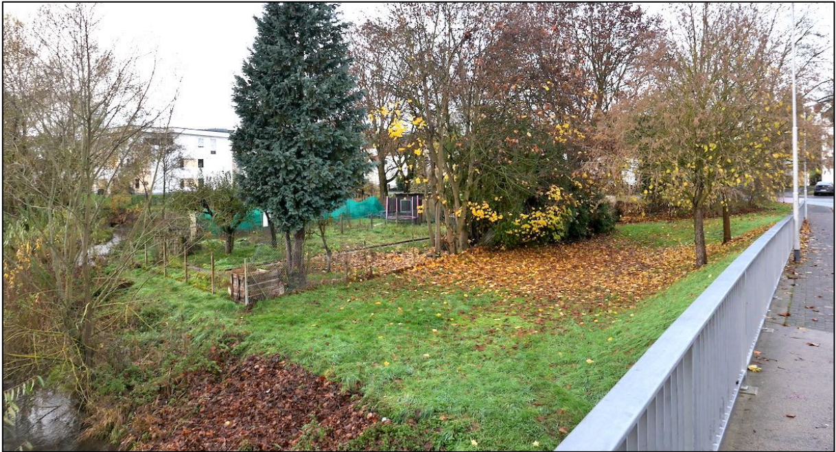
Abbildung 3: Die aufgelassene Kleingartenzeile von der Solmsbachbrücke der Brückenstraße (11/2022)