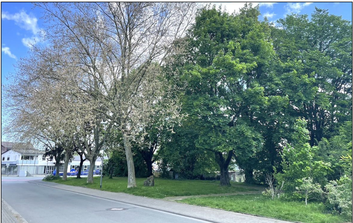
Abbildung 4: Der Park an der Bahnhofsstraße von Süden her (06/2023)